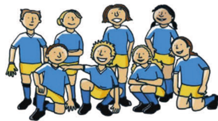
team van 8 kinderen